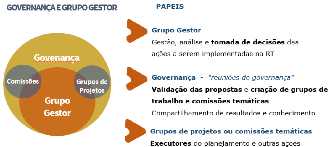
Figura 1 - Elaborado por Jorge Duarte